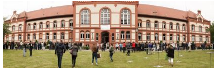
Hauptgebäude der Medizinischen Hochschule Brandenburg