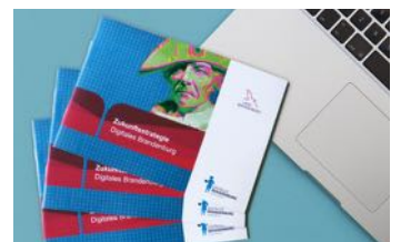
Digitalisierungsstrategie des Landes

https://msgiv.brandenburg.de/msgiv/de/presse/pressemitteilungen/detail/~20-11-2020-zukunftswerkstatt-innovative-versorgung-2020